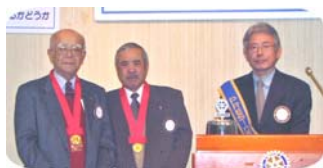
飯塚会員、小椋会員