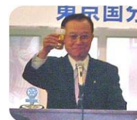
乾杯挨拶 津野田次年度会長