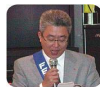
田畑親睦委員長(東京武蔵国分寺RC)